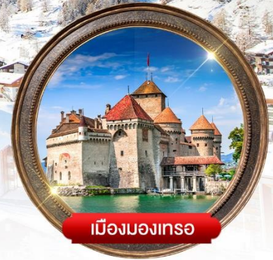
เมืองมงเทรอ