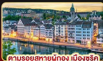
ตามรอยสายมูของ เมืองซูริค