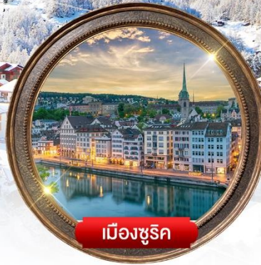
เมืองซูริก