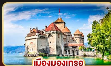
เมืองมงเทรอ