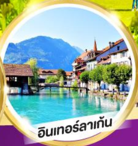
อันเทอร์ลาเกิน