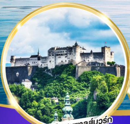
ปราสาทไฮอนซาลส์บวร์ก