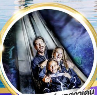
เหมืองเกลือเบิร์กเทสกาเดน