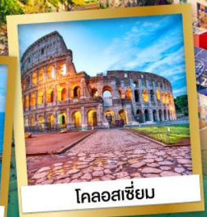
โคลอสเซียม