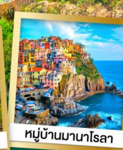
หมู่บ้านมานาโรลา