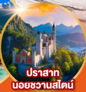
ปราสาท นอยชวานสไตน์