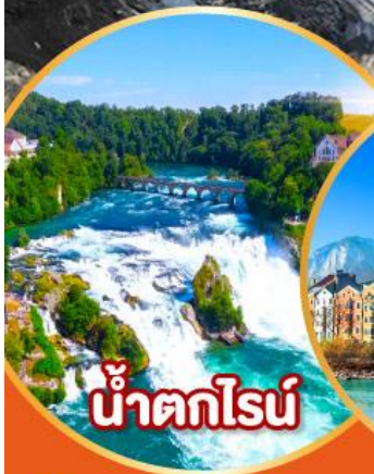
น้ำตกไรน์