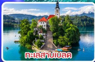
ทะเลสาบเบล็ด

ไข่มุกแห่งอาเดรียติก พร้อมขึ้นกระเช้า SRD