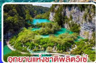
อุทยานแห่งชาติพลิตวิเช่