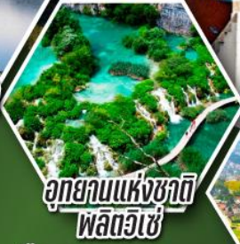
อุทยานแห่งชาติ พลิตวิเซ่