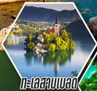
ทะเลสาบเบลด