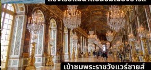
เข้าชมพระราชวังแวร์ซายส์