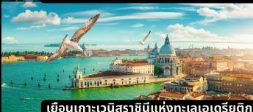
เยือนเกาะเวนิสราชนิแห่งทะเลเอเดรียติก