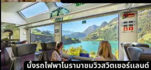
นั่งรถไฟความเร็วสูงในรามามิวสวิตเซอร์แลนด์