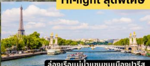
ล่องเรือแม่น้ำแซนชมเมืองปารีส