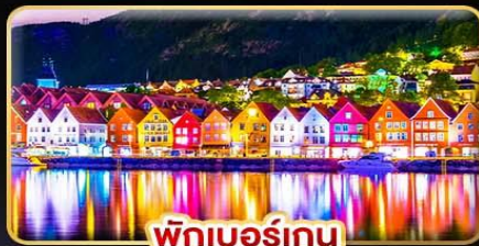
พิกเบอร์เกน