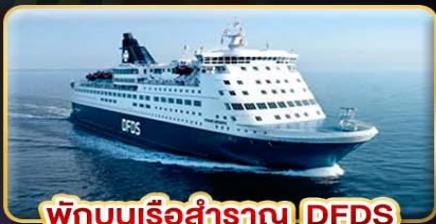
พิกบนเรือสำราญ DFDS