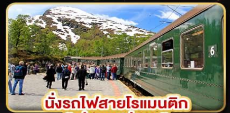
นั่งรถไฟสายโรแมนติก “ฟรอมสปานา”