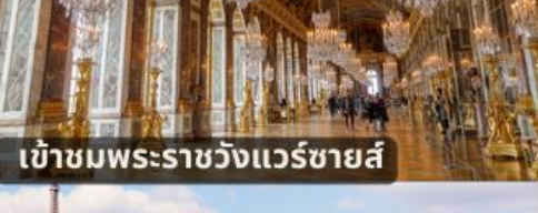
เข้าชมพระราชวังแวร์ซายส์