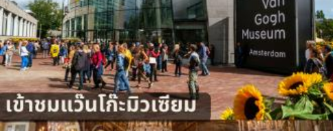
เข้าชมแวนโก๊ะมิวเซียม