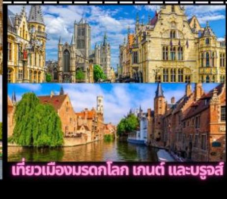
เที่ยวเมืองมรดกโลก เกนต์ และบรูจส์