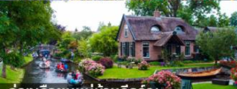
ล่องเรือชมหมู่บ้านกีร์รุณ

สายการบินการตาร์แอร์เวย์ บินเข้า อัมสเตอร์ดัม บินออก ปารีส นำหนักกระเป๋า 25 กก.