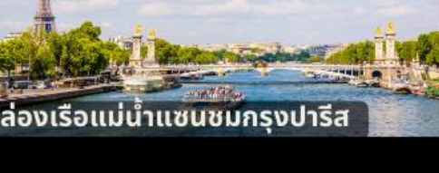
ล่องเรือแม่น้ำแซนชมกรุงปารีส