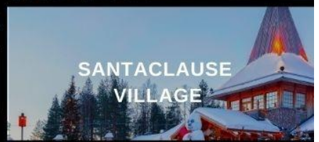
SANTA CLAUSE VILLAGE