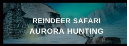
REINDEER SAFARI AURORA HUNTING