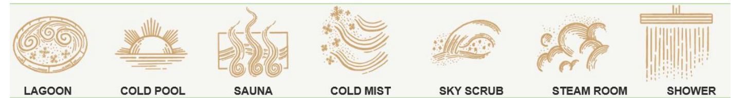
LAGOON COLD POOL SAUNA COLD MIST SKY SCRUB STEAM ROOM SHOWER

16.00 น. เดินทางสู่เมืองบอร์กาเนส ตั้งอยู่ในเขตฟยอร์ดบอร์การ์ฟยอร์ดัวร์ บนคาบสมุทรสไนล์แฟลชเนส