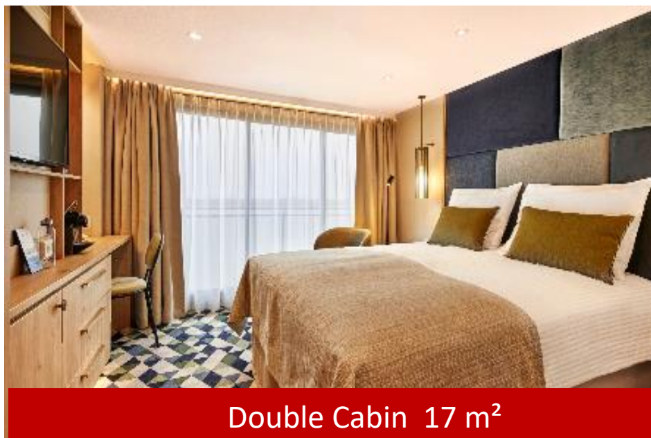
Double Cabin 17 m 2