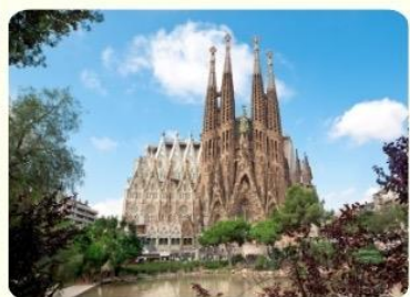
บาร์เซโลน่า ★