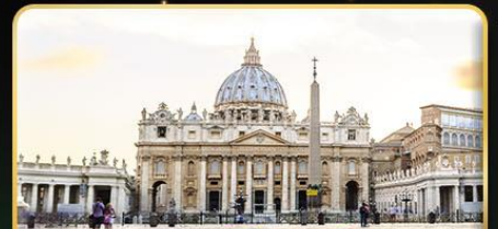
เซนต์ปีเตอร์