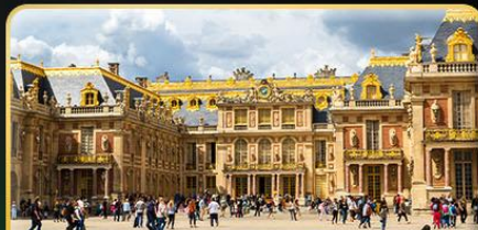
พระราชวังแวร์ซาย