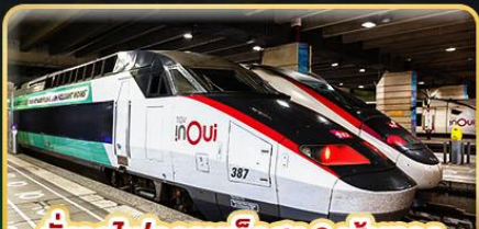
นั่งรถไฟความเร็วสูง 2 เส้นทาง PARIS - LYON & VENICE - ROME

📅 เดินทาง : 11-20 ก.พ. 68 | 15-24 มี.ค. 68