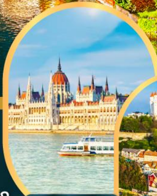
ส่องเรือแม่น้ำดานูบ