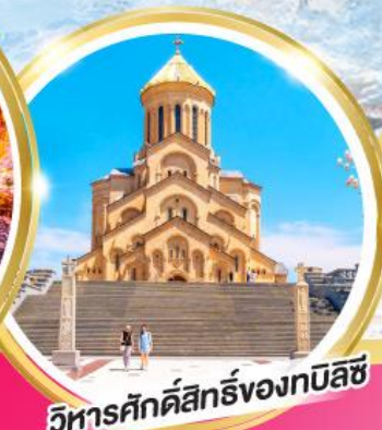
วิหารศักดิ์สิทธิ์ของทบิลีซ