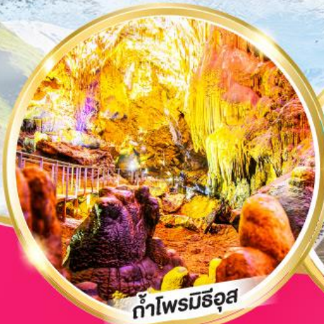
ถ้ำไฟรมีรุส