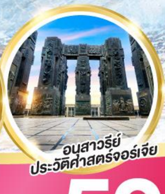
อนุสาวรีย์ประวัติศาสตร์จอร์เจีย