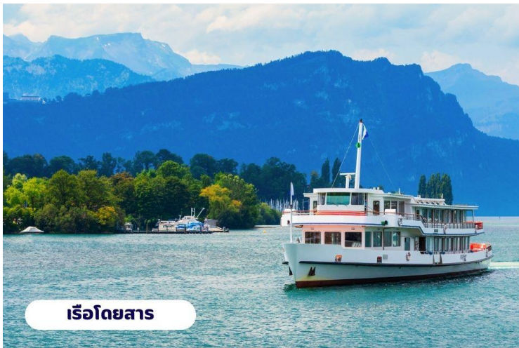
เรือโดยสาร

📍 บริการอาหารเช้า ณ ห้องอาหารของโรงแรม จากนั้นนำท่านเดินทางสู่ ยอดเขาริกิ (Rigi Kulm) โดยใช้การเดินทางโดยเรือจากทะเลสาบลูเซิร์นไปยังท่าเรือวิทซ์เนา (Vitznau) จากนั้นนั่งรถไฟไต่เขา Rigi ถือได้ว่าเป็นรถไฟไต่เขาที่เก่าแก่ที่สุดในยุโรป และยังเป็นอันดับ 2 รองจากยอดเขาวอชิงตัน ในมลรัฐนิวแฮมป์เชียร์ สหรัฐอเมริกา ความสูงจากระดับน้ำทะเล 1,797 เมตร จนมาถึงยอดเขาริกิ (Rigi Kulm) ซื่อนี้มีที่มาจากคำว่า Mons Regina แปลได้ว่าราชินีแห่งภูเขา เพราะสามารถมองเห็นทิวทัศน์ของยอดเขาอื่นๆ ได้รอบ 360 องศา ชมวิวแบบพาโนรามาโอบล้อมด้วยธรรมชาติของทะเลสาบ Luzern และ Zug อิสระทุกท่าน ถ่ายรูปชมวิวตามอัธยาศัย