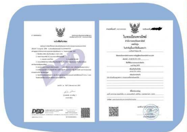
ตัวอย่างหนังสือจดทะเบียนบริษัทฯ และ ใบทะเบียนพาณิชย์