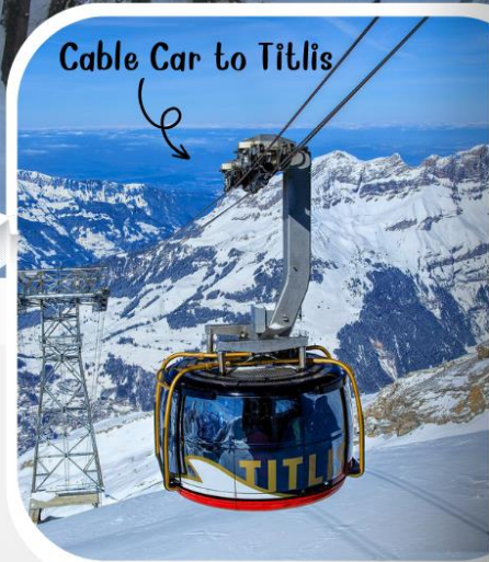
Cable Car to Titlis