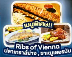
เมนูพิเศษ!! Ribs of Vienna ปลาเทราสย่าง, บาหมูเยอรมัน