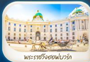
พระราชวังฮอฟบวร์ก

12-18 มี.ค.68 / 19-25 มี.ค.68 28 เม.ย. - 4 พ.ค.68 7-13 พ.ค.68