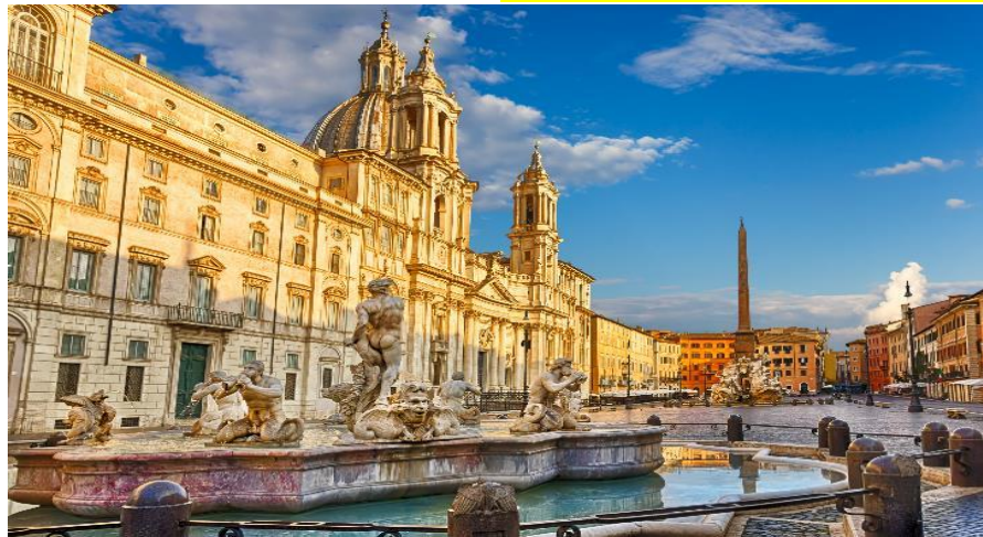
โบสถ์สโตนบาโรก

นำท่านสู่ จัตุรัสนาโวนา (PIAZZA NAVONA) จัตุรัสที่มีชื่อเสียงมากที่สุดและสวยที่สุดในกรุงโรม เต็มเปี่ยมไปด้วยความมีชีวิตชีวาของผู้คนที่เยี่ยมเยียนแล้ว ดิกรามบ้านช่องสีส้มสดใส ร้านไอศกรีมเจลลาโต้ ร้านกาแฟเก๋ๆ และร้านอาหาร ทั้งน้ำพุสวยๆ มากมายหลายจุดในบริเวณนี้ เช่น FONTANA DEI QUATTRO FIUMI และน้ำพุตุ้มหานที่มีเสาโอเบลิสก์ ด้านหน้า SANT'AGNESE