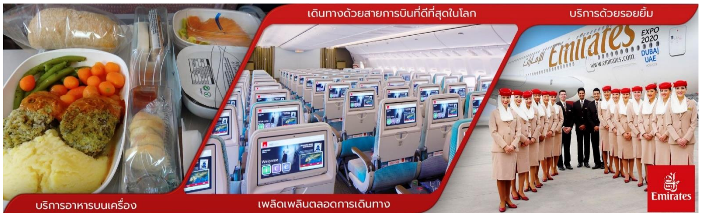
บริการอาหารบนเครื่อง

23.30 น. คณะพร้อมกันที่ สนามบินสุวรรณภูมิ ชั้น 4 บริเวณเคาน์เตอร์ T สายการบินเอมิเรตส์ EMIRATES AIRLINE (EK) โดยมีเจ้าหน้าที่ช่องทางบริษัทฯ คอยต้อนรับ และอำนวยความสะดวกด้านเอกสาร ออกบัตรที่นั่งและโหลดสัมภาระในการเดินทาง