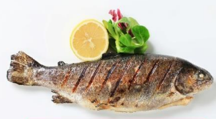
พิเศษ!! ปลาเทราต์ย่าง

นำท่านเดินทางสู่ เมืองลินซ์ (Linz) (ระยะทาง 125 กม./ 2 ชม.) เป็นเมืองที่มีการผลิตเหล็ก เครื่องจักร อุปกรณ์ไฟฟ้า อดีตเป็นศูนย์กลางการค้าที่สำคัญ ให้ท่านถ่ายรูปบริเวณด้านนอก พิพิธภัณฑ์แห่งโลกอนาคต (Ars Electronica Center) ตั้งอยู่ริมแม่น้ำดานูบ เป็นที่จัดแสดงวิทยาการต่างๆ ที่ส่งผลต่อมวลมนุษยชาติปัจจุบัน ไม่ว่าจะเป็นอวกาศ หุ่นยนต์และเอไอ ยารักษาโรค เป็นต้น