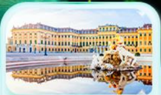
พระราชวังเซินบรุนน์