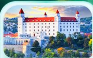
ปราสาทบราติสลาวา

เที่ยวชมเมืองฮัลล์สตัดท์ หมู่บ้านริมทะเลสาบสวยที่สุดในโลก พระราชวังเซินบรุนน์ เมืองลินซ์ จัตุรัสฮาพท์พลาทซ์ สัมผัสเมืองมรดกโลก เซสท์ ครุมลอฟ เยี่ยมชมปราสาทปราก ถนนทองคำ เข็ดอั้นสถานที่ชื่อดัง! ปราสาทบราติสลาวา ส่องเรือชมความงามแม่น้ำดานูบ แม่น้ำที่ยาวที่สุดในยุโรป ชมความน่าหลงใหลของ ปราสาทบูคาเปสต์ สะพานชาร์ลส์