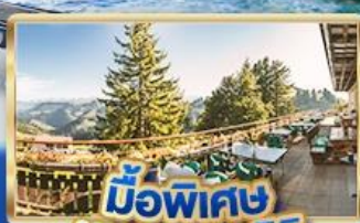
มือพิเศษ บทยอดเวาริค