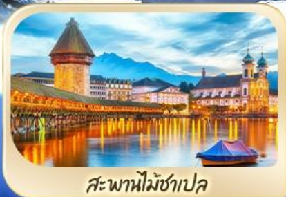
สะพานไมซ์าเปค