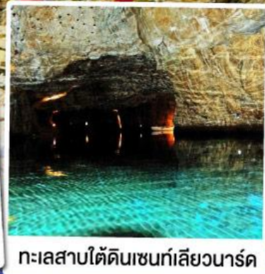
ทะเลสาบไตดินเซนท์เลียวนาร์ด

ล่องเรือชมทะเลสาบไตดินเซนท์เลียวนาร์ด ทะเลสาบไตดินลึกลับ สุดUnseenแห่งสวิตเซอร์แลนด์