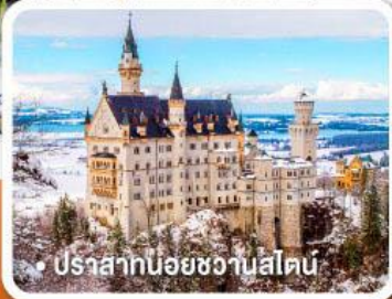
• ปราสาทน้อยชวานสไตน์