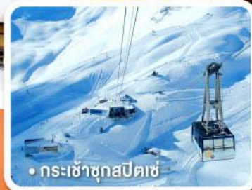
• กระเช้าชุกสปีดเซ