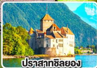
ปราสาทซิลยอง