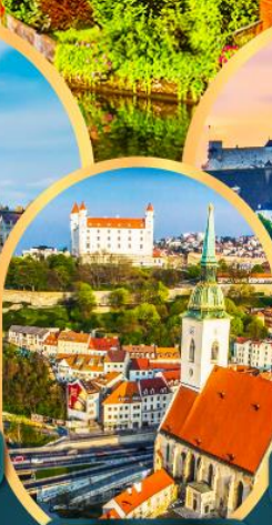
ปราติสลาวา