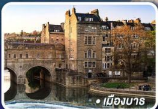
• เมืองบาส