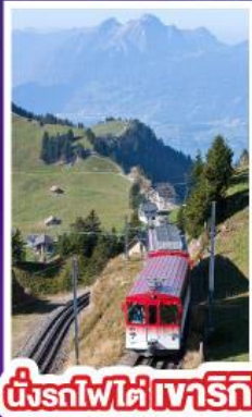
นั่งรถไฟใต้เจาท์