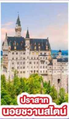
ปราสาท นอยชวานสไตน์