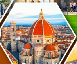
ฟลอเรนซ์