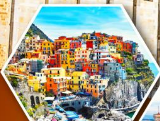
หมู่บ้านมานาโรซ่า