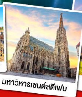
มหาวิหารเซนต์สตีเฟ่น