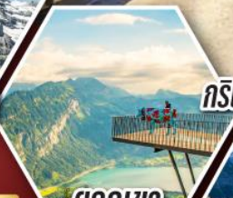
ยอดเขา ฮาร์เตอร์คลุม