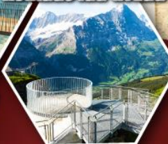
ยอดเขา กรินเดลวาลด์ เฟยสตี