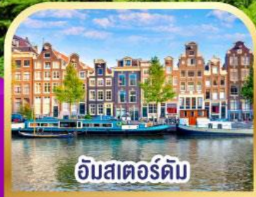
อัมสเตอร์ดัม