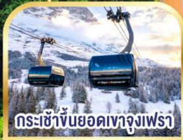
กระเช้าขึ้นยอดเขาจุงเฟรา