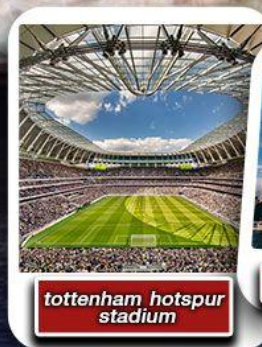
tottenham hotspur stadium