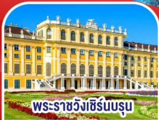
พระราชวังซิรินบรูม