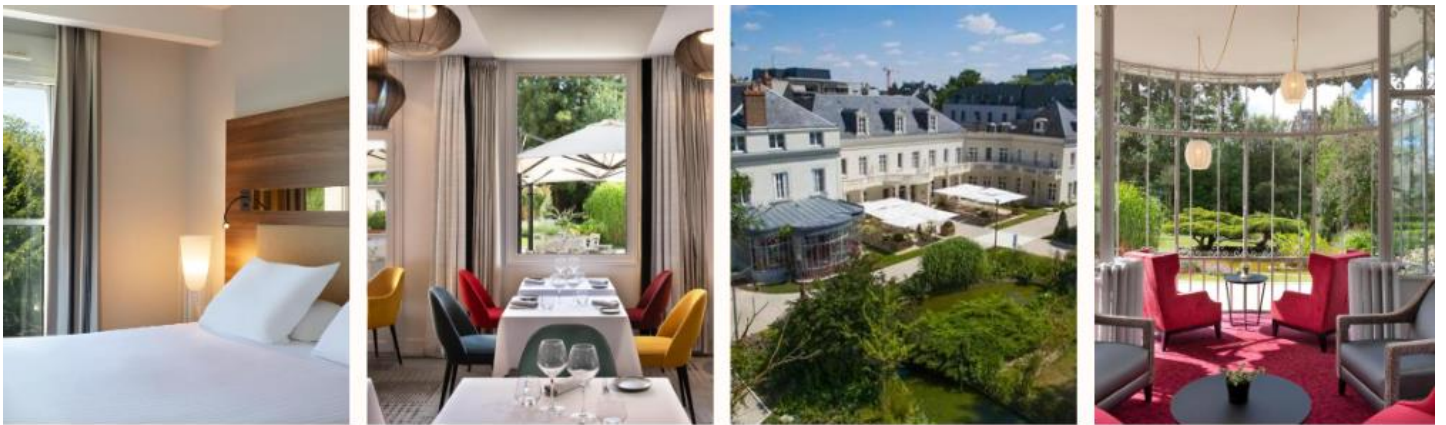
CHATEAU BELMONT TOURS BY THE CREST COLLECTION. .HAVEN OF PEACE IN THE CITY CENTER OF TOURS.

ค่ำ รับประทานอาหารค่ำ ณ ภัตตาคาร นำท่านเข้าสู่ ที่พัก CHATEAU BELMONT TOURS BY THE CREST COLLECTION. หรือเทียบเท่า