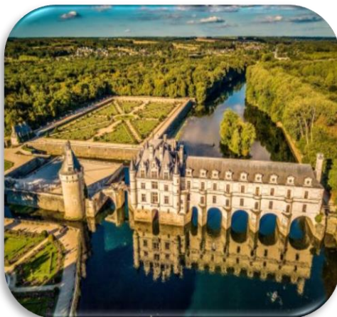
CHATEAU DE CHENONCEAU