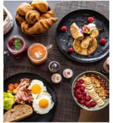
HOTEL PULLMAN PARIS LA DEFENSE JUST 10 MINUTES AWAY FROM THE CHAMPS-ÉLYSÉES