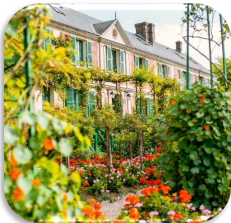
MONET'S GARDEN IN GIVERNY