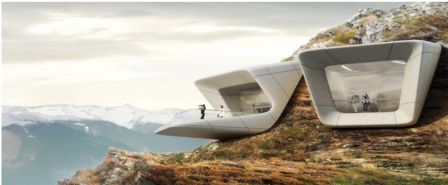
MMM CORONES; Dolomite viewing at 2,275 m.