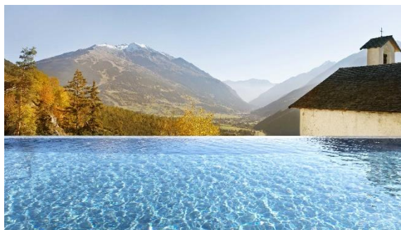
QC TERME GRAND BAGNI NUOVI