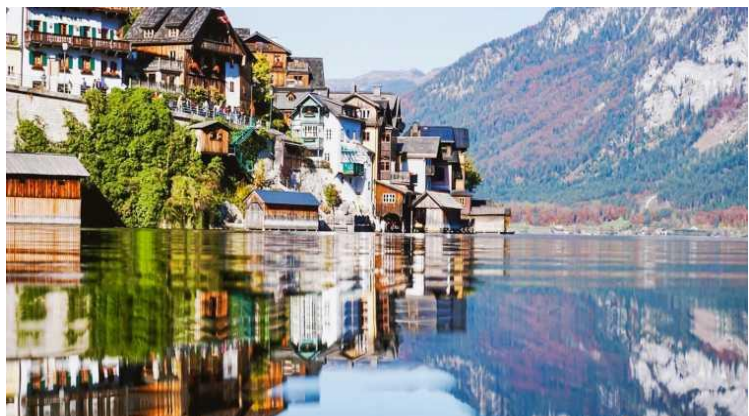
Medieval houses in Hallstatt