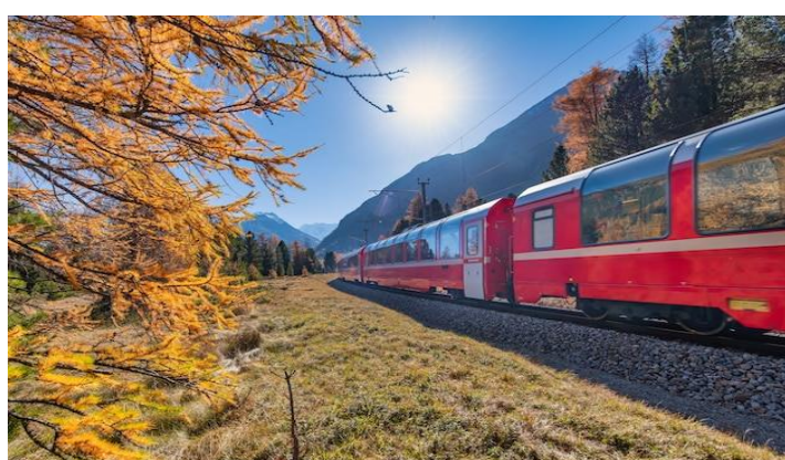
Bernina Express in Autumn