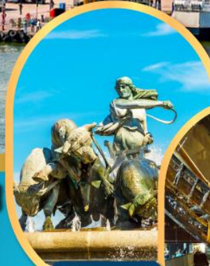
น้ำพุแห่งราชินีกฟ็อน