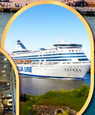
เรือสำราญ TALLINK SILJA LINE