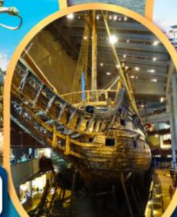
พิพิธภัณฑ์เรือทว่าซา