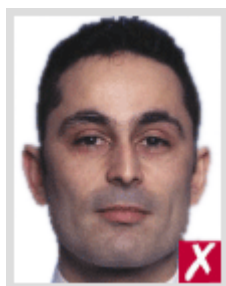
ใกล้เกินไป