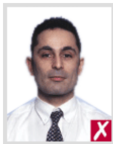
ไกลเกินไป