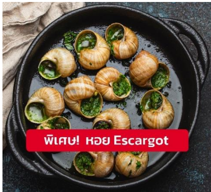
พิเศษ! หอย Escargot

📍 รับประทานอาหารเที่ยง (เมื่อที่11) เมนูพิเศษ!! หอย Escargot