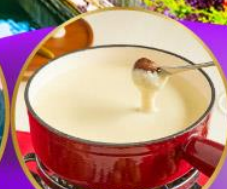
ฟองดูซีส