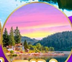
ทิกิเซ่ ปาดำ