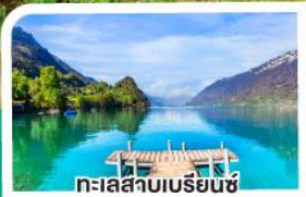
ทะเลสาบเบรียนซ์