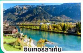
อินเทอร์ลาเก้น