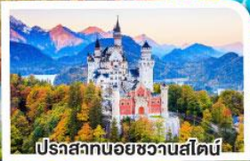
ปราสาทนอยชวานสไตน์