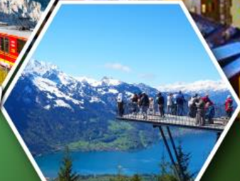
ยอดเขาอาร์เตอร์คูลม

พักเมืองเชอร์แมก เมืองตากอากาศระดับโลก ที่มีฉากหลังเป็นยอดเขามรดกโลก