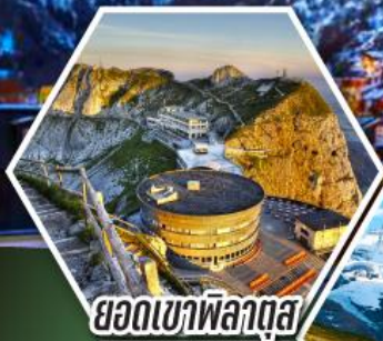
ยอดเขาพิลาตุส