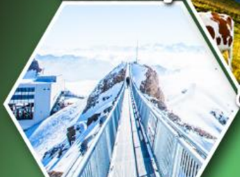
ยอดเขากลาเซียร์ 3000