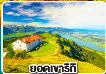
ยอดเขารัทท์