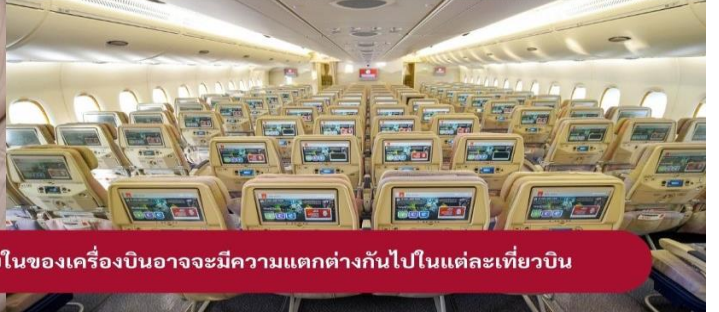
Aircraft ของสายการบินที่จะให้บริการรวมถึงการตกแต่งภายในของเครื่องบินอาจมีความแตกต่างกันไปในแต่ละเที่ยวบิน