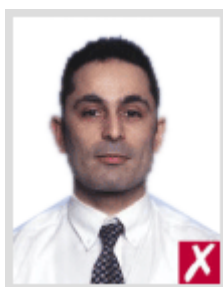
ไกลเกินไป