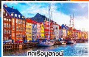
ท่าเรือชวานัน