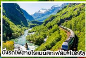
นั่งรถไฟสายโรเมนติกฟิลมึนโคริส