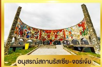
อนุสรณ์สถานรัสเซีย-จอร์เจีย

นั่งรถ 4WD ตะลุยสู่ใจกลางเทือกเขาคอเคซัส | เข้าชมวิหารศักดิ์สิทธิ์ ซามิบา เที่ยวเมืองดำอันเก่าแก่ อพอลิสซ์เคห์ | พิเศษ มื้ออาหารไทย ณ กรุงทบิลีซี