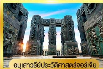
อนุสาวรีย์ประวัติศาสตร์จอร์เจีย

พัก ROOMS HOTEL ชมวิวสุดอลังการของเทือกเขาคอเคซัส