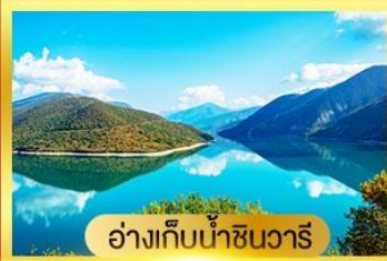
อ่างเก็บน้ำชันวารี