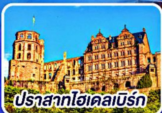
ปราสาทไอเคิลเบิร์ก